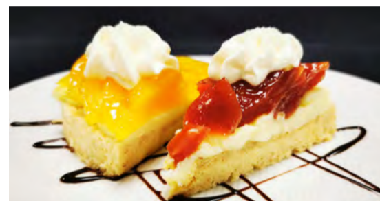
Fruchtwähe von Aprikosen und Zwetschgen