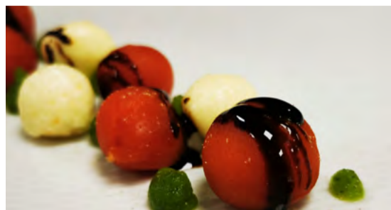
Tomaten-Mozzarella mit Basilikum