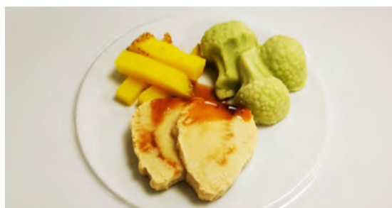
Schweinsbraten an Biersauce mit Pommes Frites und Broccoli