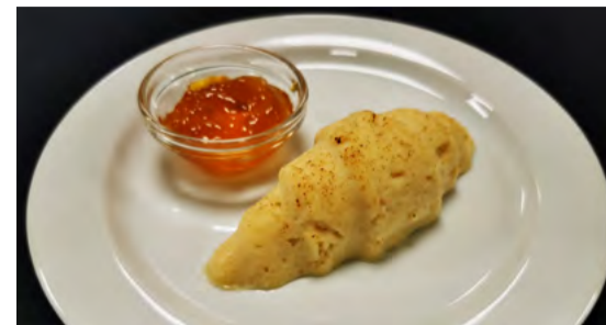
Frühstücks-Gipfeli mit Konfitüre