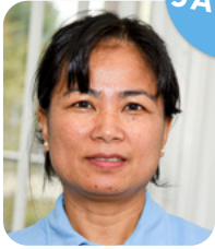
Chin Nurem Betreuungsperson Pflege im PG